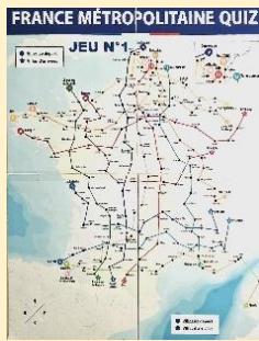
PLAN JEU N°1