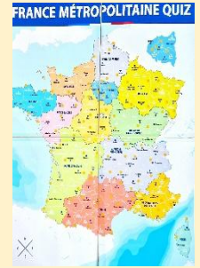
PLAN JEU N°2 – 3 – 4